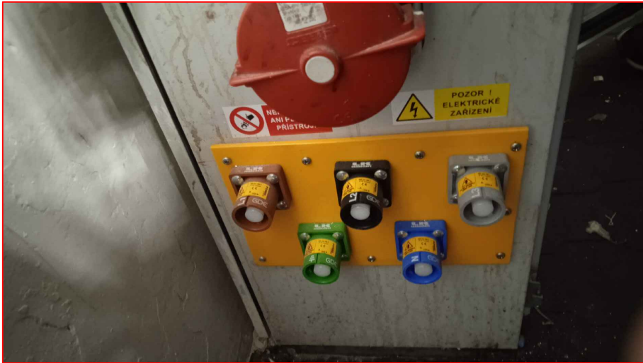
VZOROVÉ PROVEDENÍ V MX2